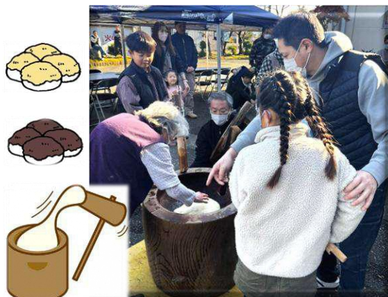
「よいしょ！」の掛け声が響く！

つき立てのお餅は、あんこやきな粉、大根おろし、すり胡麻など、さまざまな味付けで楽しむことができ、参加者はみんな笑顔で冬の風物詩を満喫しました。