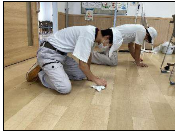
綺麗な部屋にして頂き感謝です!

10月から11月にかけて4回、県立高田特別支援学校白嶺分校の生徒さんから、館内の部屋などを清掃して頂きました。