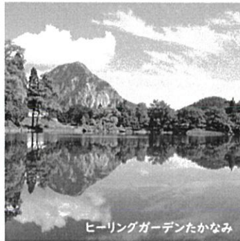
ヒーリングガーデンたかなみ